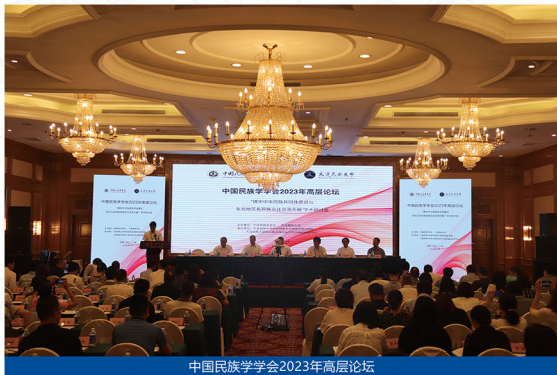
中国民族学学会2023年高层论坛

本学科以习近平新时代中国特色社会主义思想为指导，以铸牢中华民族共同体意识为主线，整合中华民族共同体研究院（学院）、马克思主义学院、政法学院、外国语学院等研究力量，坚守社会科学的学科属性，以对党和国家、对人民和社会高度负责的责任感，深入开展中华民族与世界民族研究，构建中国特色民族学学科体系、学术体系、话语体系，为强国建设、民族复兴提供知识供给、思想支持和人才支撑。