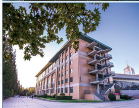
翻译硕士【MTI】（英语笔译）专业硕士学位授权点所在单位